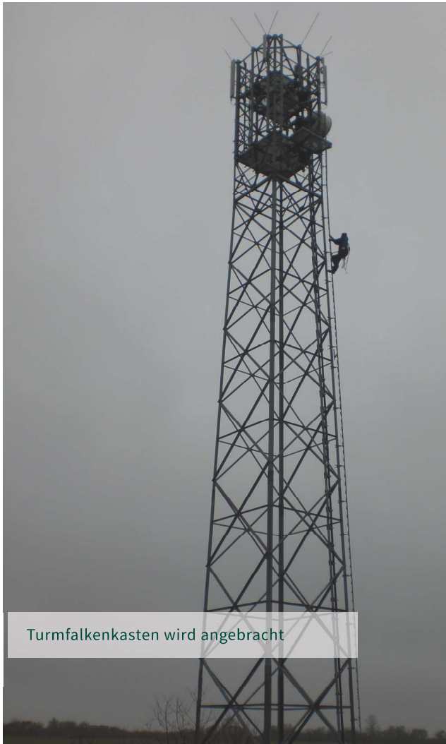
Turmfalkenkasten wird angebracht