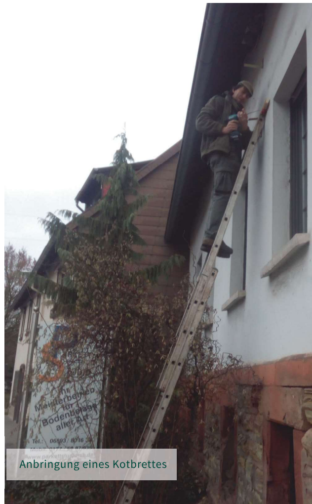
Anbringung eines Kotbrettes