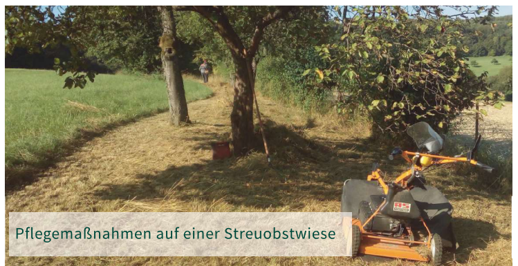
Pflegemaßnahmen auf einer Streuobstwiese