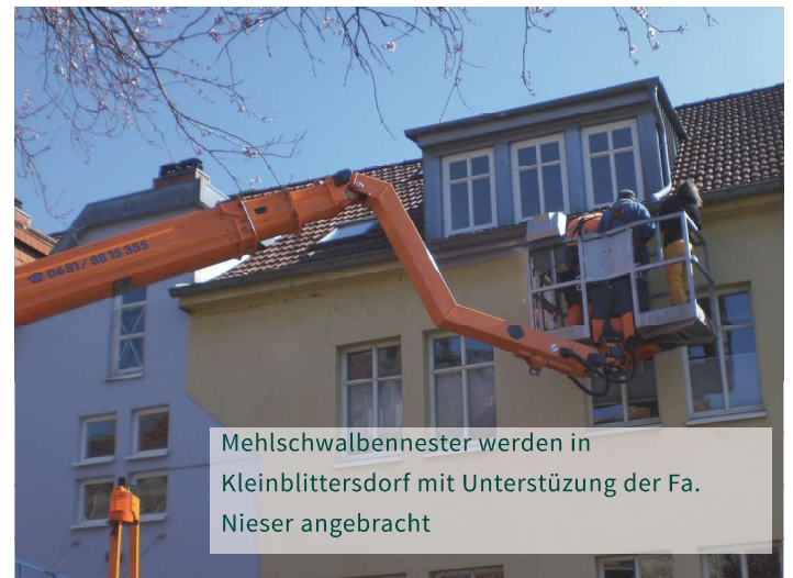
Mehlschwalbennester werden in Kleinblittersdorf mit Unterstützung der Fa. Nieser angebracht