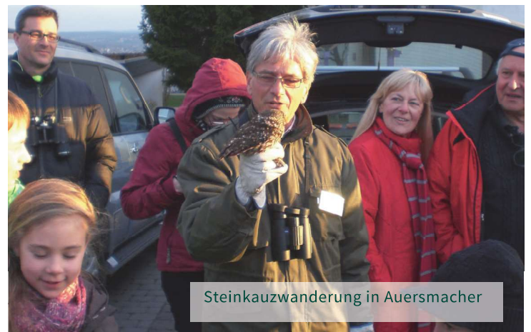
Steinkauzwanderung in Auersmacher