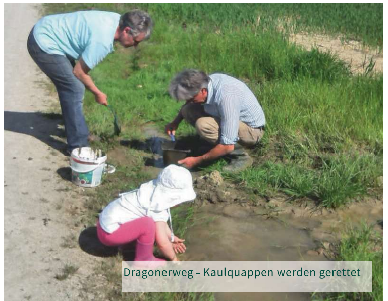
Dragonerweg - Kaulquappen werden gerettet