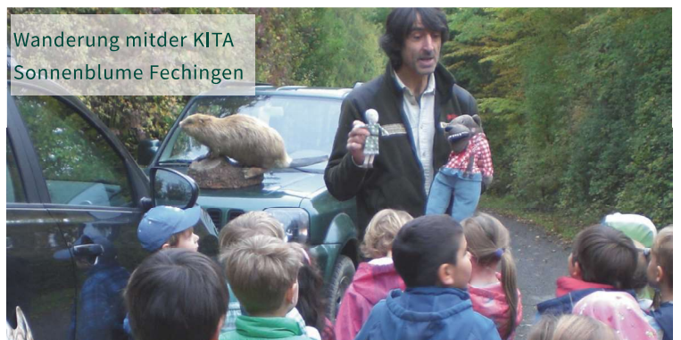
Wanderung mit der KITA Sonnenblume Fechingen