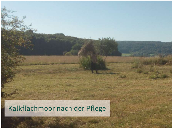
Kalkflachmoor nach der Pflege