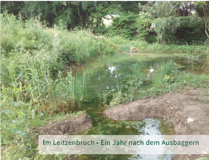
Im Leitzenbruch - Ein Jahr nach dem Ausbaggern