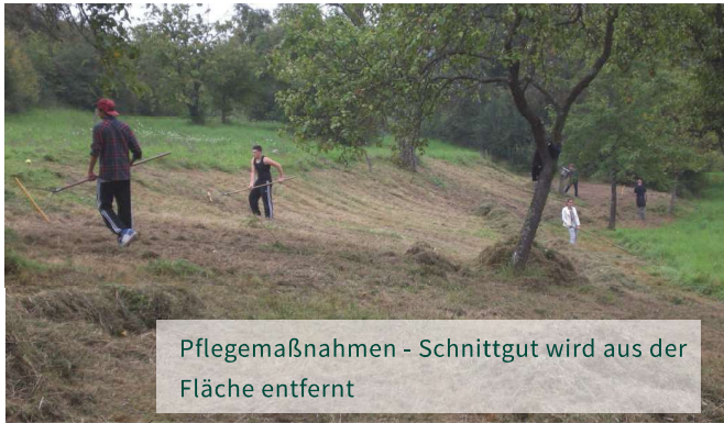
Pflegemaßnahmen - Schnittgut wird aus der Fläche entfernt