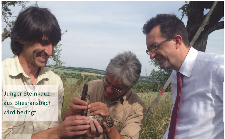
Junger Steinkauz aus Bliesransbach wird beringt