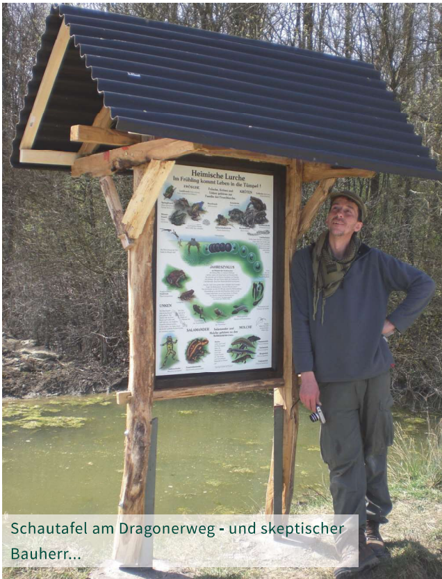
Schautafel am Dragonerweg - und skeptischer Bauherr...