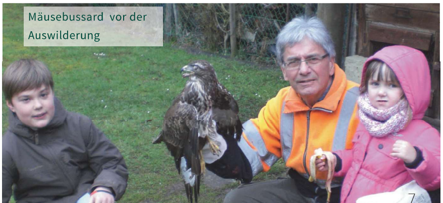
Mäusebussard vor der Auswilderung