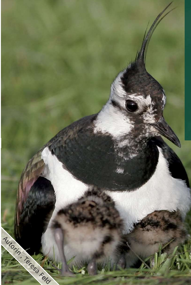
Autorin, Teresa Feld