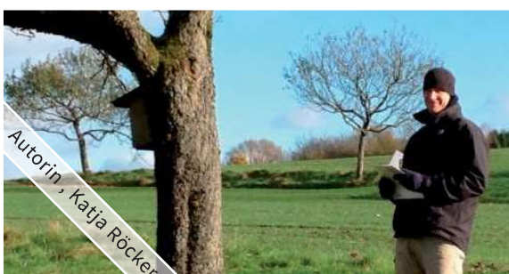
Autorin, Katja Röcker